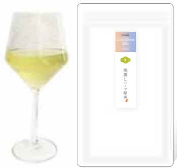
浅蒸しハーブ緑茶 Asamushi cha 80 Ginger 10 Mint 10