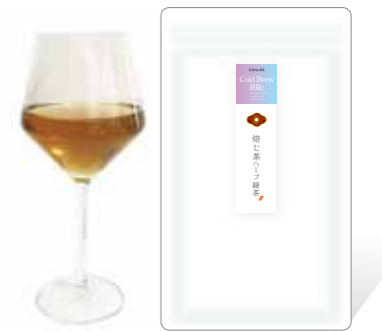
焙じ茶ハーブ緑茶 Houji cha 70 Ginger 20 Mint 10