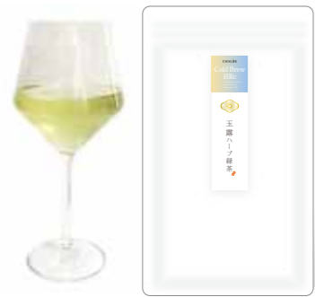
玉露ハーブ緑茶 Gyokuro 75 Lemongrass 15 Rosemary 10

毎日の生活に寄り添う上質な水分補給「水出しハーブ緑茶」という新しいドリンクスタイル提案です。