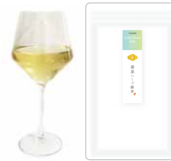
番茶ハーブ緑茶 Ban cha 70 Rosemary 20 Mint 10