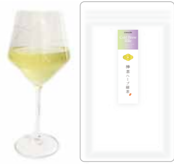
棒茶ハーブ緑茶 Bou cha 75 Chamomile 10 Rosemary 15