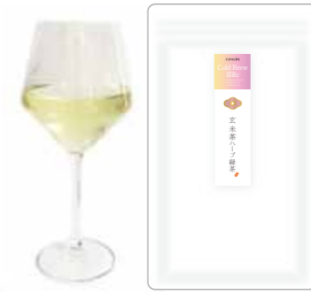
玄米茶ハーブ緑茶 Genmai cha 75 Chamomile 15 Mint 10