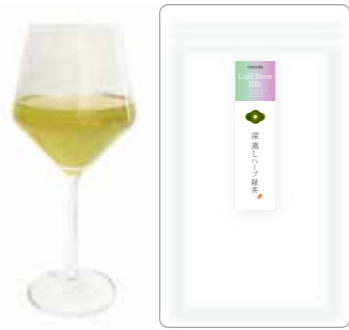
深蒸しハーブ緑茶 Fukamushi cha 75 Chamomile 15 Mint 10